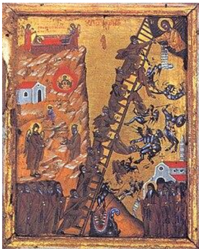
Icoon van De Ladder van de Goddelijke Opstijging (de treden naar de theosis zoals beschreven door Johannes Climacus) met monniken die de ladder naar Jezus beklimmen (en ervan afdalen), Sint-Catharinaklooster